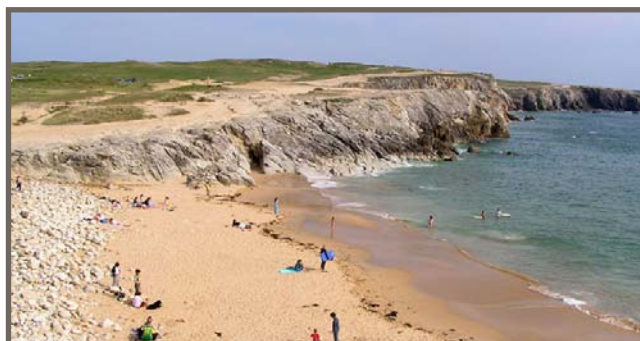
Plage sur la Presqu'île de Quiberon