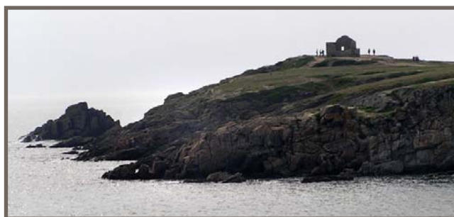
Côte sauvage de la Presqu'île de Quiberon