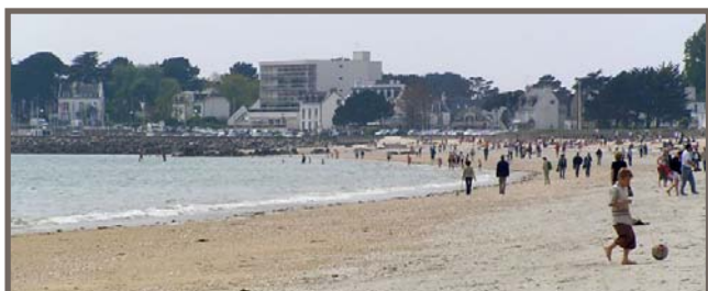
Grande Plage de Carnac