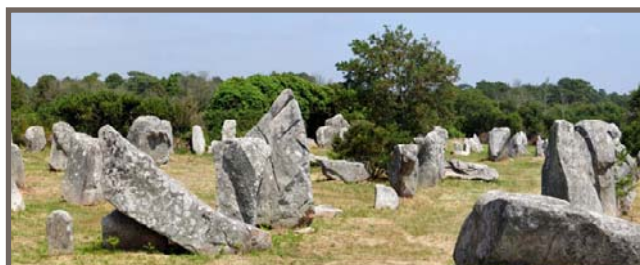
Alignements de Carnac