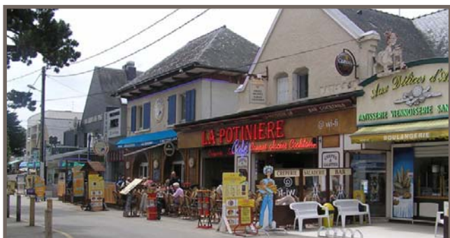
Commerces / Restaurants à Carnac-Plage

Voici quelques clichés de Carnac-Plage (la grande plage, commerces, alignements) et de la Presqu'île de Quiberon (la Côte Sauvage, les plages insolites...)